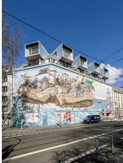
Bildzeile: Bilker Bunker Außenansicht