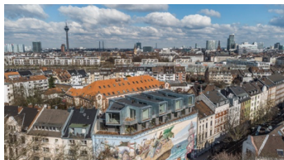
Bildzeile: Bilker Bunker Drohnenansicht